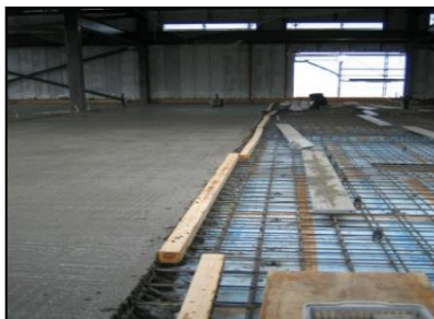
脱型 (夏季:20~30分・冬季30~40分程度)