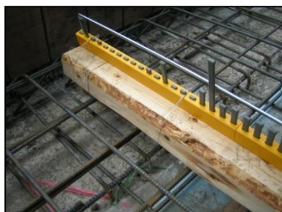
栈木にスラブフェンス極を結束線で固定