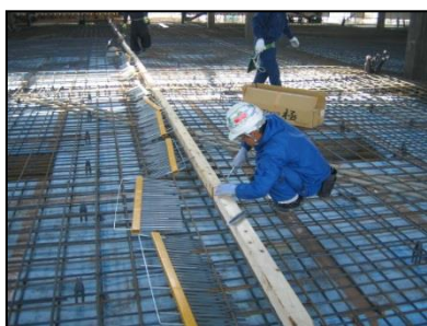
配筋に結束線を使い 固定用の栈木を固定